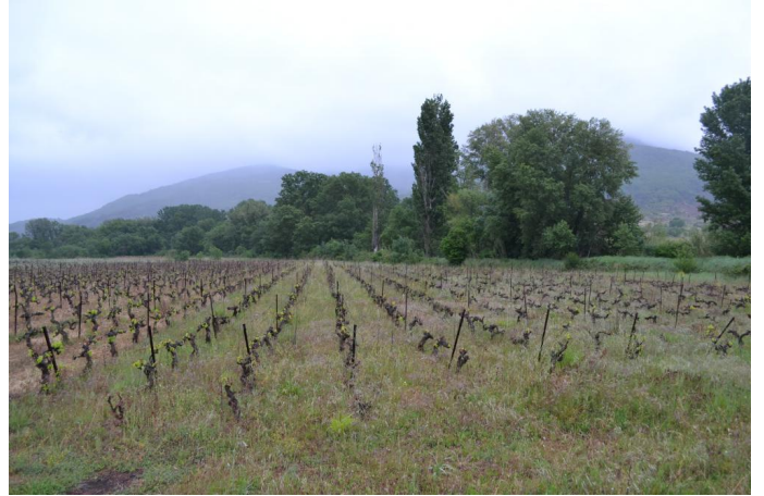
Vers les Faysses, le 11/05/2017 par Jérémy Cuvelier.