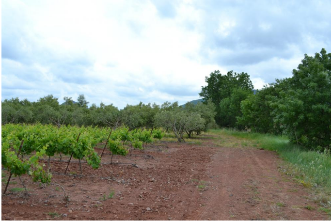
Vers le Moulinas, le 10/05/2017 par Jérémy Cuvelier.