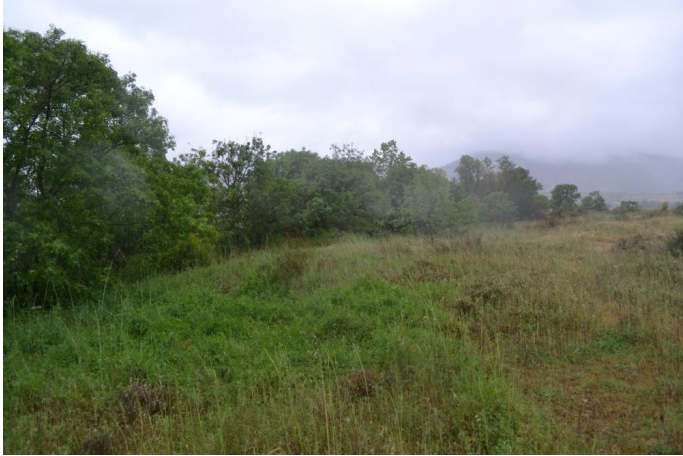
Vers Roques, le 11/05/2017 par Jérémy Cuvelier.