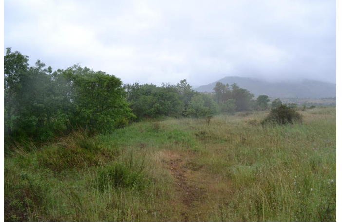
Vers Planès, le 11/05/2017 par Jérémy Cuvelier.