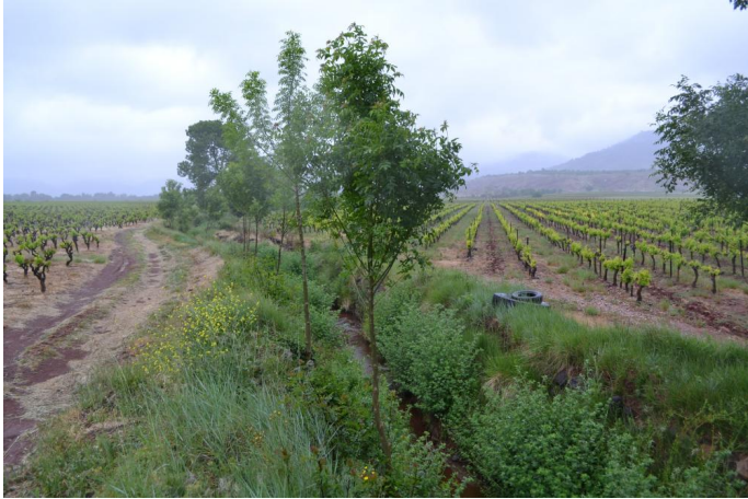
Ripisylve discontinue en contexte viticole vers l'Arnède, le 11/05/2017 par Jérémy Cuvelier.