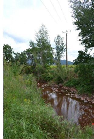
Ripisylve dégradée en amont et en aval du pont de la RD8, le 10/05/2017.