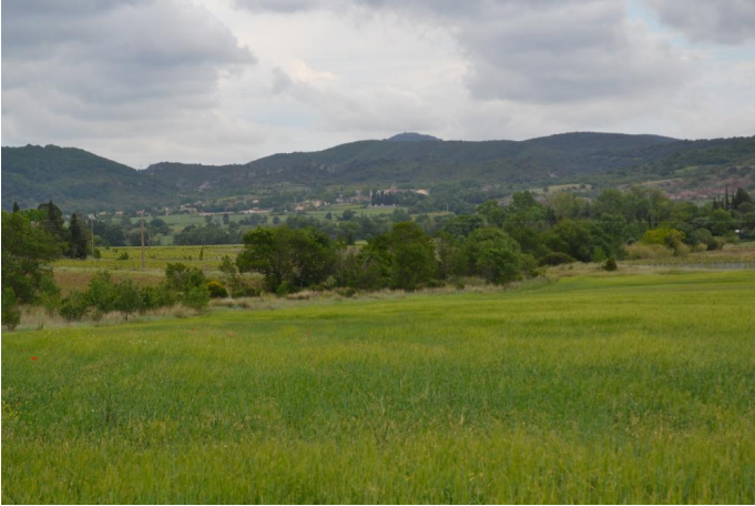
Ripisylve du Salagou vers les Poujoulasses, le 10/05/2017 par Jérémy Cuvelier.