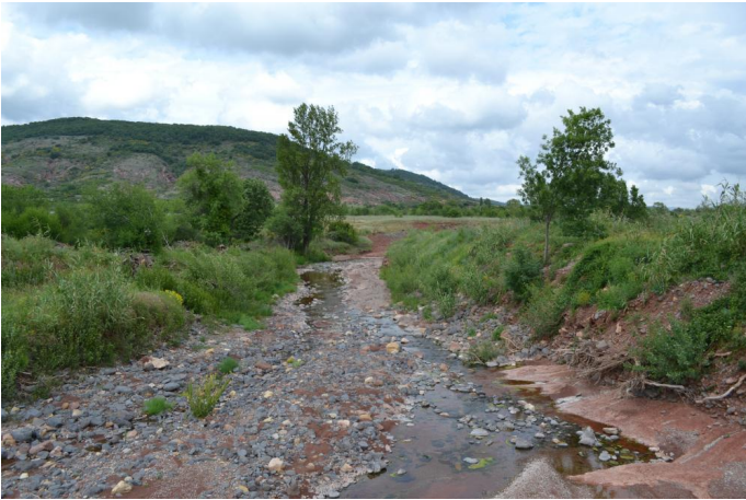
en aval du pont de la RD8, le 10/05/2017 par Jérémy Cuvelier.