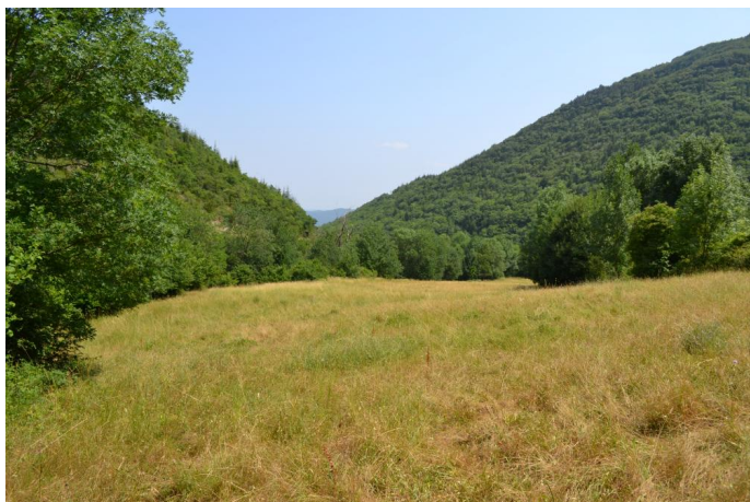
Ripisylve continue vers les Valettes, le 21/06/2017 par Jérémy Cuvelier.