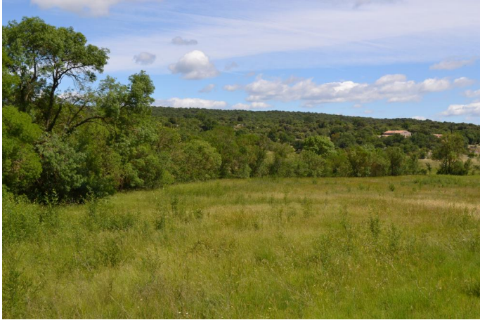
Cordon de Frênes sur cours d'eau à écoulements temporaires, le 06/06/2017 par Jérémy Cuvelier.