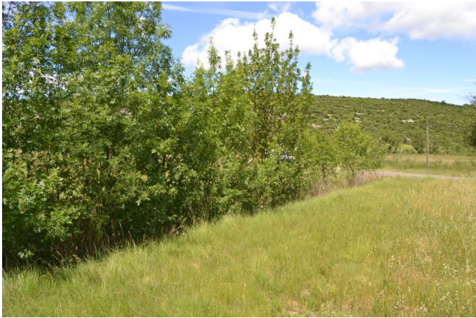
, le 06/06/2017 par Jérémy Cuvelier.