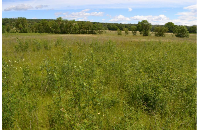
, le 06/06/2017 par Jérémy Cuvelier.