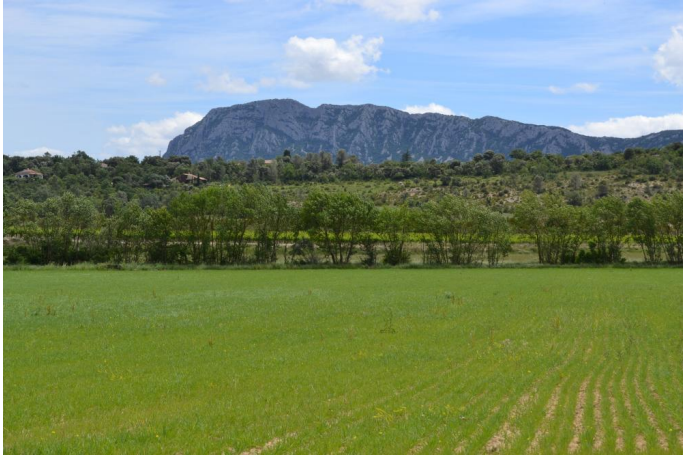
Cordon de Frênes sur cours d'eau canalisé à écoulements temporaires en contexte agricole, le 06/06/2017.