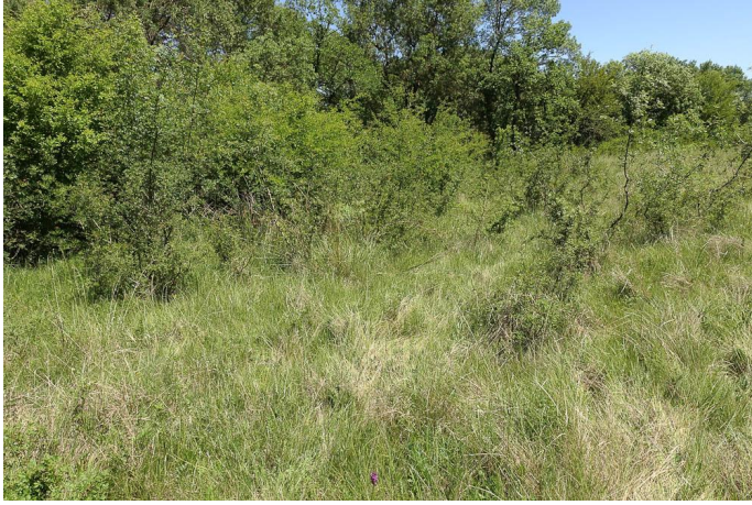
Prairie à orchidées., le 25/05/2017 par Jean-Laurent Hentz.