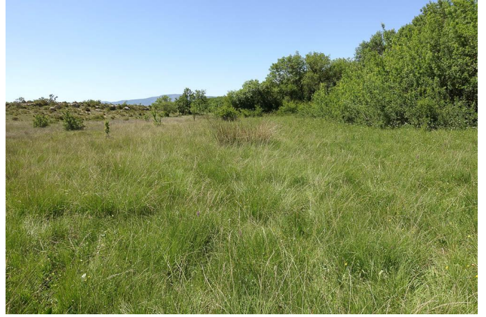
Prairie à orchidées., le 25/05/2017 par Jean-Laurent Hentz.