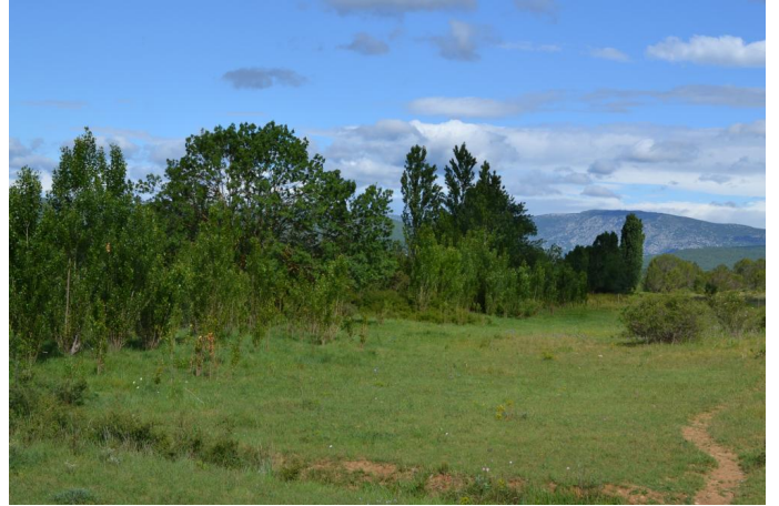
, le 06/06/2017 par Jérémy Cuvelier.