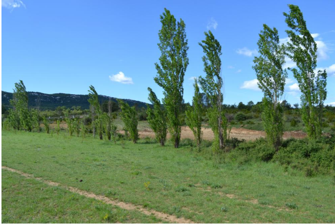
Plantation de Peupliers d'Italie vers Mas noir, le 06/06/2017 par Jérémy Cuvelier.