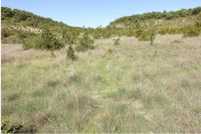
Prairie à Choin noir sur marnes., le 25/05/2017 par Jean-Laurent Hentz.