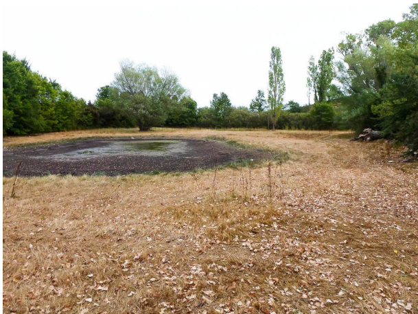
La lavogne avec très peu d'eau en fin d'été sec..., le 03/09/2017 par Danièle Tixier-Inrep.