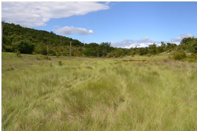
zone humide de pente colonisée par le Choin noir, le 06/06/2017 par Jérémy Cuvelier.