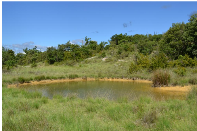
mare en contrebas de la zone humide de pente, le 06/06/2017 par Jérémy Cuvelier.