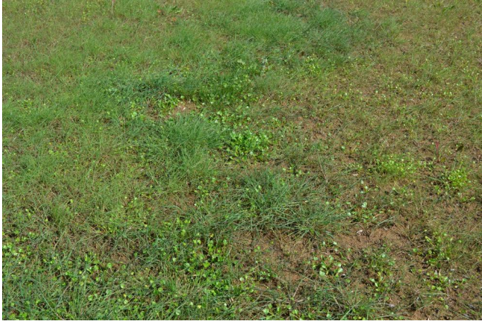
Aperçu de la ripisylve de l'Arre en aval du Vigan, le 07/09/2017 par Jérémy Cuvelier.