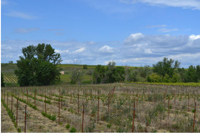
Ripisylve dégradée de Frênes, le 03/05/2017.