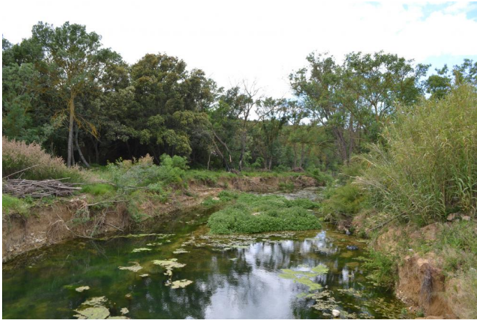
Ripisylve dégradée et berges érodées, le 03/05/2017 par Jérémy Cuvelier.