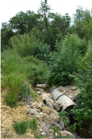
Aperçu de la ripisylve dégradée dominée par les Frênes, le 03/05/2017.