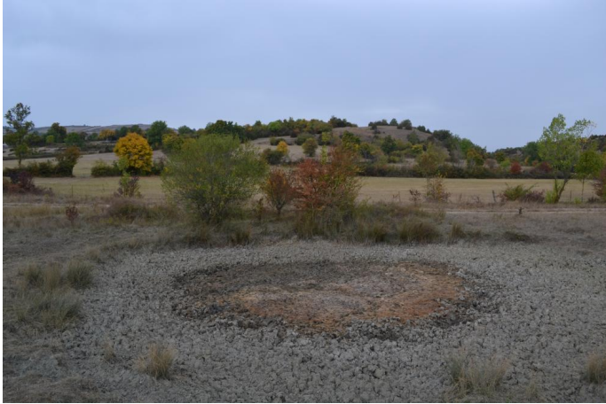
Aperçu de la mare asséchée, le 25/09/2017.