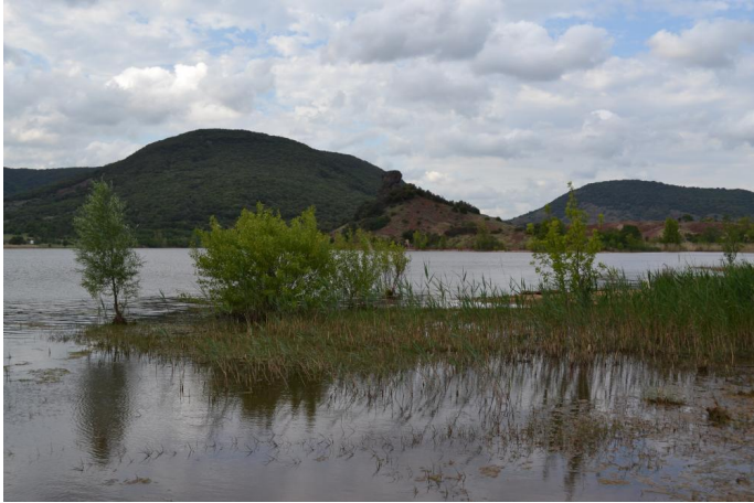
Cordon de roselière sur les berges du lac, le 10/05/2017 par Jérémy Cuvelier.