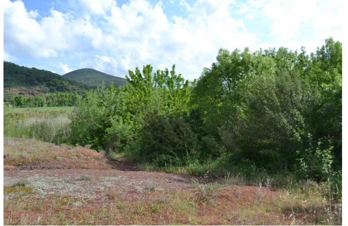
, le 10/05/2017 par Jérémy Cuvelier.