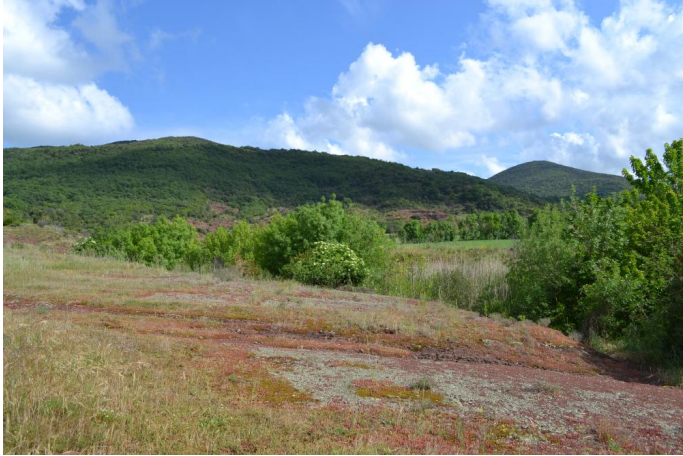
Cordon de Frênes sur cours d'eau à écoulements temporaires, le 10/05/2017 par Jérémy Cuvelier.