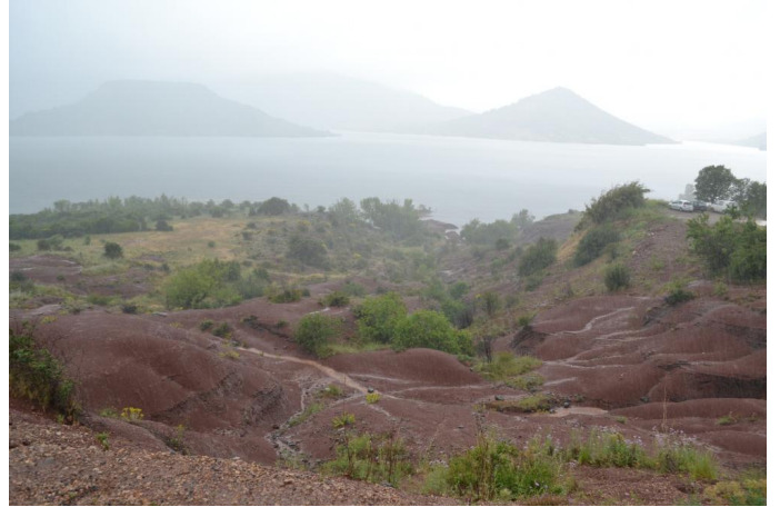
Cordon de Frênes, le 11/05/2017.