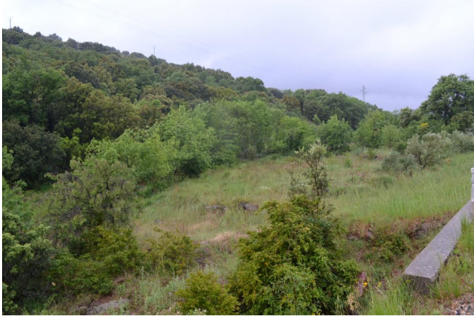
Cordon de Frênes sur cours d'eau à écoulements temporaires, le 11/05/2017 par Jérémy Cuvelier.