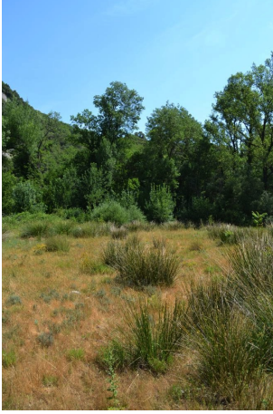
Ripisylve de Frênes et de Peupliers continue, le 14/06/2017 par Jérémy Cuvelier.