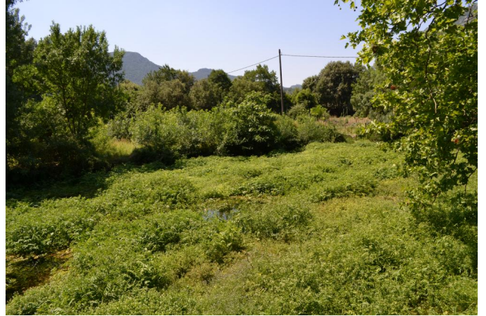
Tapis de Ache faux cresson sur la partie amont, le 14/06/2017 par Jérémy Cuvelier.