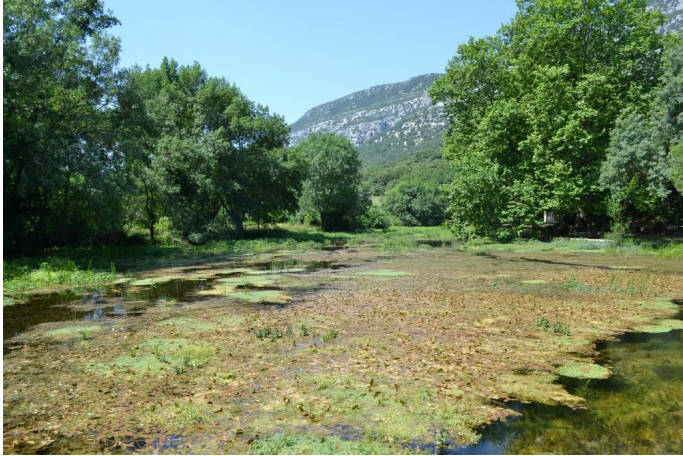
Retenue en amont du seuil colonisée par la Ache faux cresson et des massettes, le 14/06/2017 par Jérémy Cuvelier.