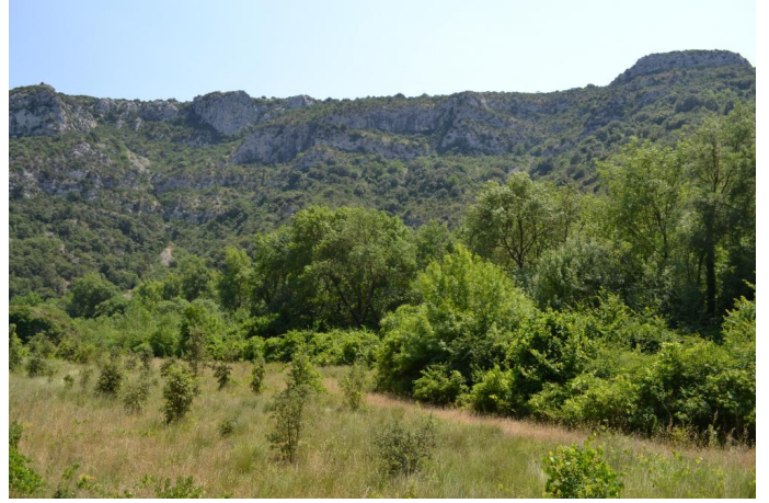
Ripisylve de Frênes et de Peupliers continue, le 14/06/2017.