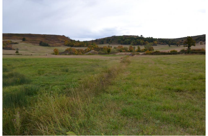
, le 25/09/2017 par Jérémy Cuvelier.