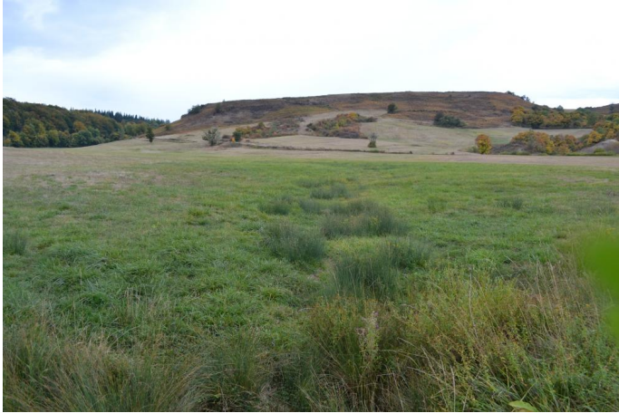
Aperçu de la prairie après un été particulièrement sec, le 25/09/2017 par Jérémy Cuvelier.