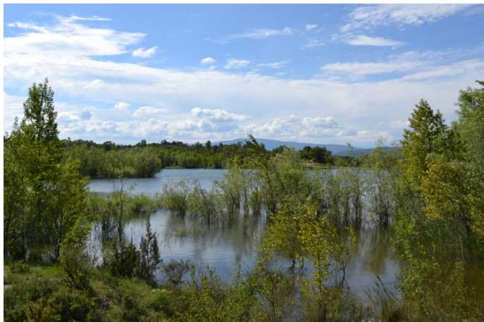
Aperçu des berges du barrage colonisées par de la ripisylve à Peupliers et Saules, le 17/05/2017.