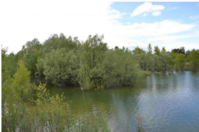
Saulaie sur les berges du barrage, le 17/05/2017 par Jérémy Cuvelier.