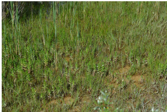
Gratiola officinalis présente sur les berges du barrage, espèce protégée au niveau national, le 17/05/2017 par Jérémy Cuvelier.