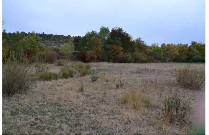
Aval de la ripisylve en queue de la retenue collinaire, le 25/09/2017 par Jérémy Cuvelier.