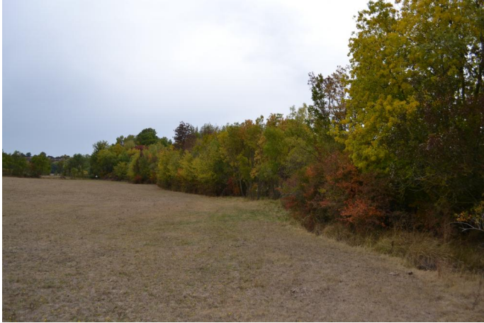
Ripisylve continue de frênes sur cours d'eau à écoulements temporaires, le 25/09/2017 par Jérémy Cuvelier.