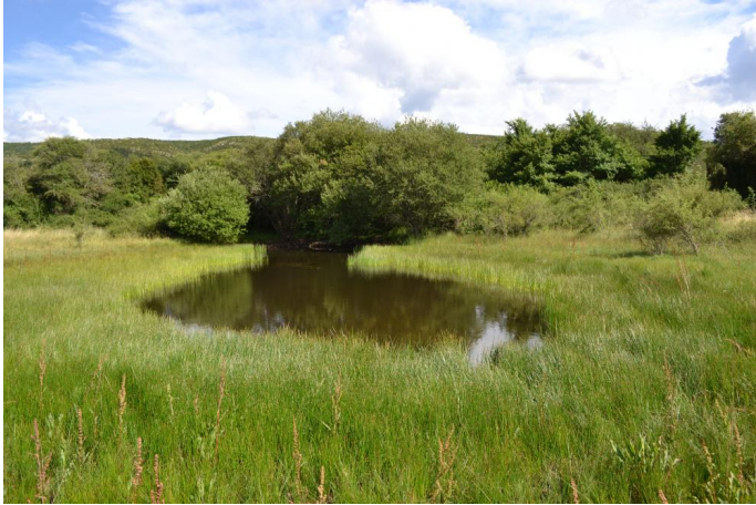
Aperçu de la mare à Scirpe des marais et Saule cendré, le 28/06/2017.