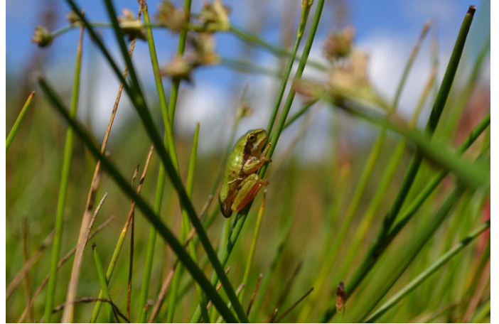
Rainette méridionale, le 28/06/2017 par Jérémy Cuvelier.