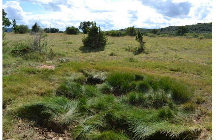
, le 28/06/2017 par Jérémy Cuvelier.