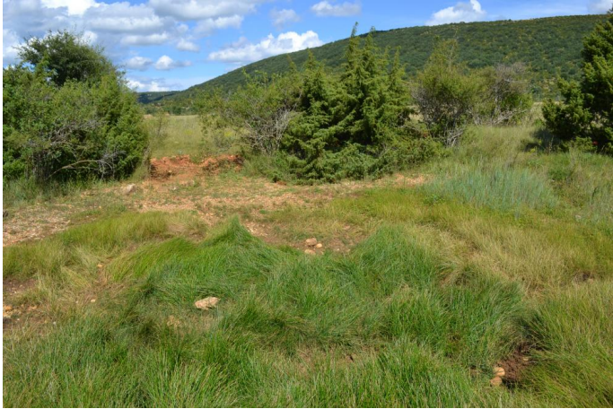
Aperçu de la mare asséchée avec du Scirpe, le 28/06/2017 par Jérémy Cuvelier.