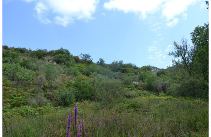
, le 20/07/2017 par Jérémy Cuvelier.