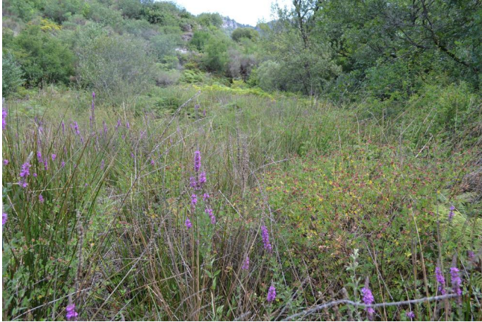
Zone humide de pente à Salicaire et Choin noir, le 20/07/2017.