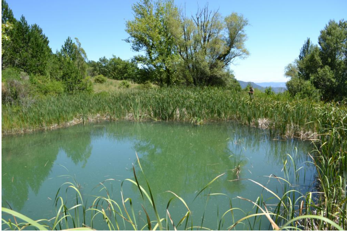
Aperçu de la mare à Typha latifolia, le 05/07/2017 par Jérémy Cuvelier.