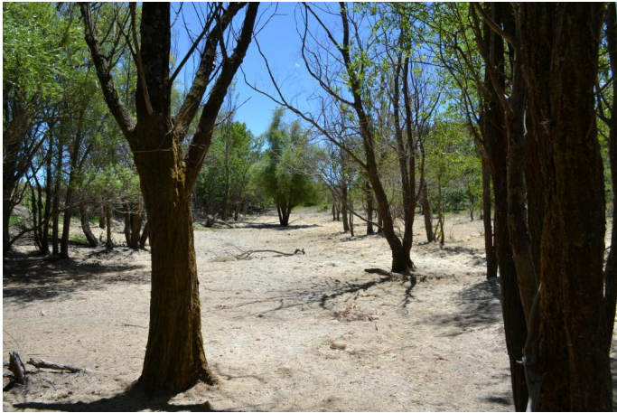
, le 05/07/2017 par Jérémy Cuvelier.