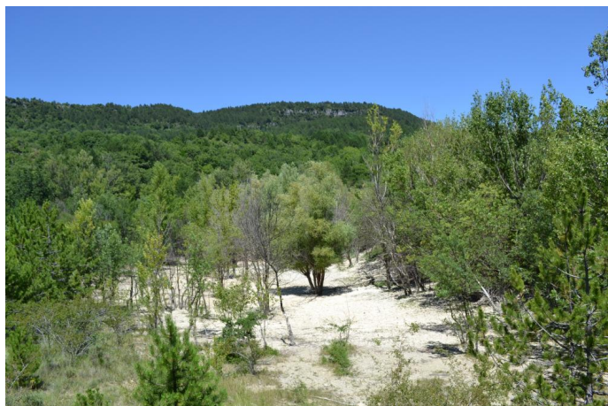
, le 05/07/2017 par Jérémy Cuvelier.