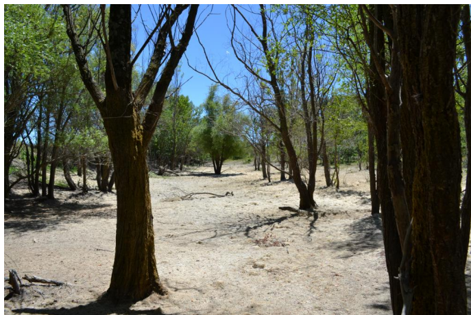
, le 05/07/2017 par Jérémy Cuvelier.