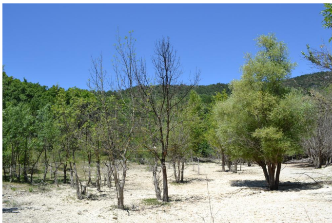
, le 05/07/2017 par Jérémy Cuvelier.