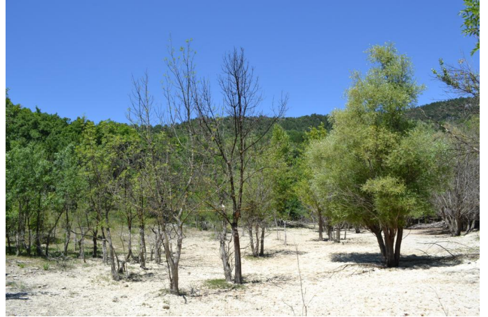
, le 05/07/2017 par Jérémy Cuvelier.