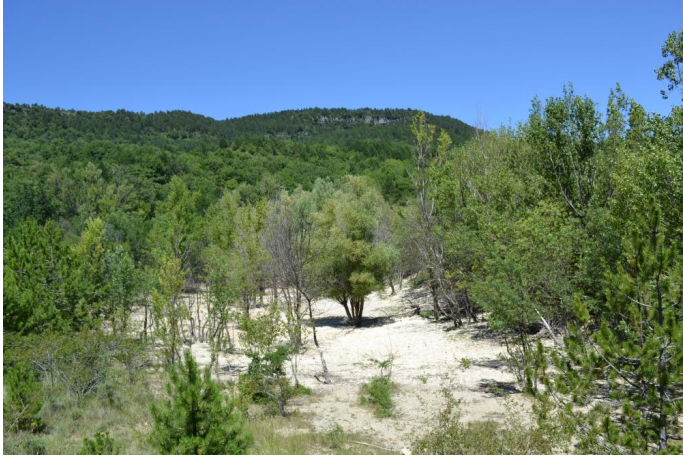
, le 05/07/2017 par Jérémy Cuvelier.