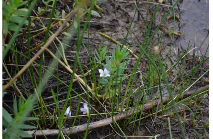
Gratiola officinalis présente sur les berges de la mare, espèce protégée au niveau national, le 17/05/2017 par Jérémy Cuvelier.