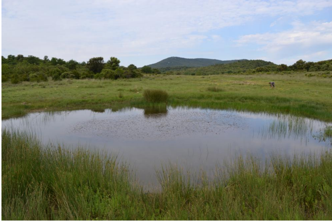
Aperçu de la mare, le 17/05/2017 par Jérémy Cuvelier.