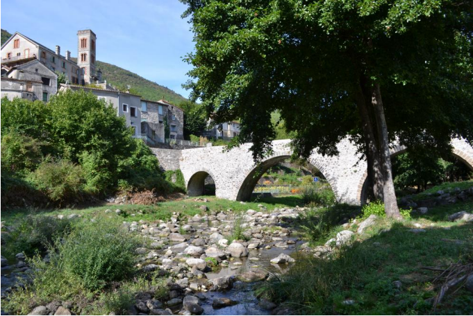
, le 07/09/2017 par Jérémy Cuvelier.