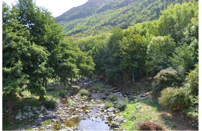
En aval d'Arre, le 07/09/2017.