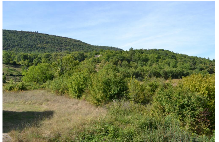
En aval de la RD789, le 07/09/2017 par Jérémy Cuvelier.