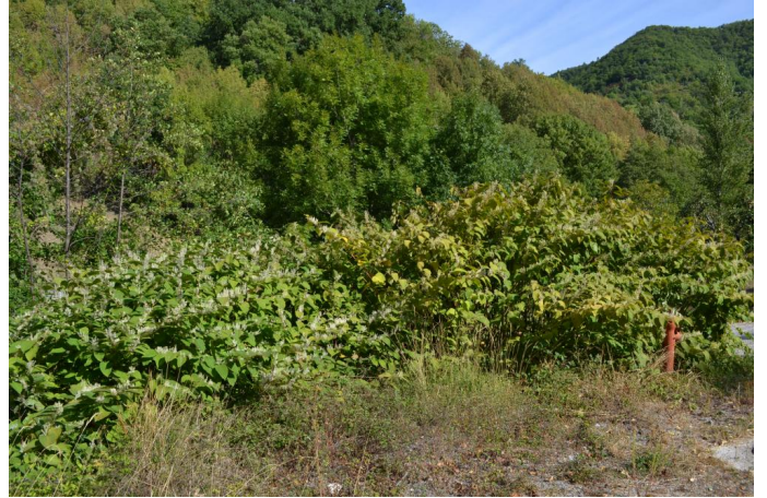
Station de Renouée du Japon (espèce végétale exotique à caractère envahissant) vers Estelle, le 07/09/2017 par Jérémy Cuvelier.