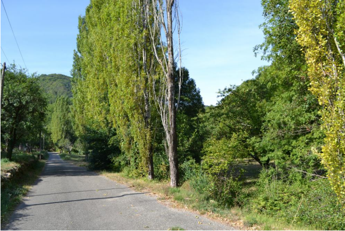
Vers Estelle, le 07/09/2017 par Jérémy Cuvelier.