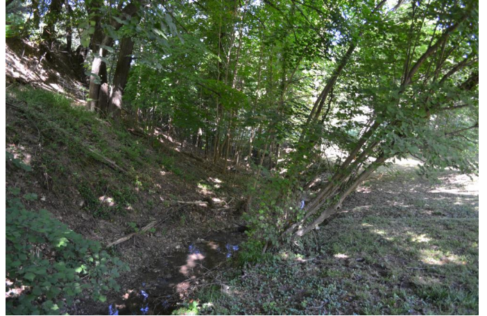
, le 05/07/2017 par Jérémy Cuvelier.