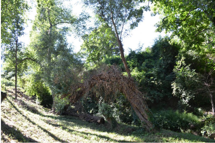
Ripisylve continue constituée par les Peupliers, Frênes et Saules blancs, le 05/07/2017.