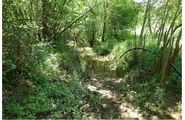
Ripisylve du Lamalou., le 26/05/2017 par Jean-Laurent Hentz.