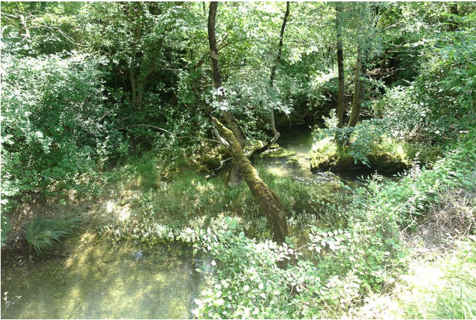
Autre vue du Lamalou en sous-bois., le 26/05/2017 par Jean-Laurent Hentz.