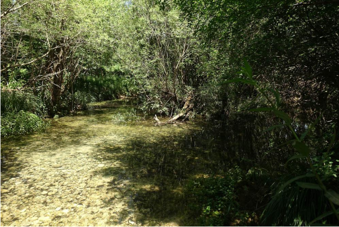
En traversant la rivière (passerelle)., le 26/05/2017 par Jean-Laurent Hentz.