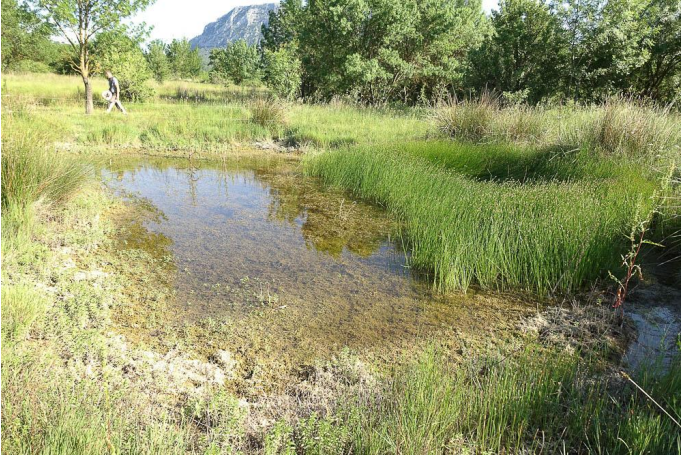
Très jolie mare dans les pâtures., le 25/05/2017 par Jean-Laurent Hentz.