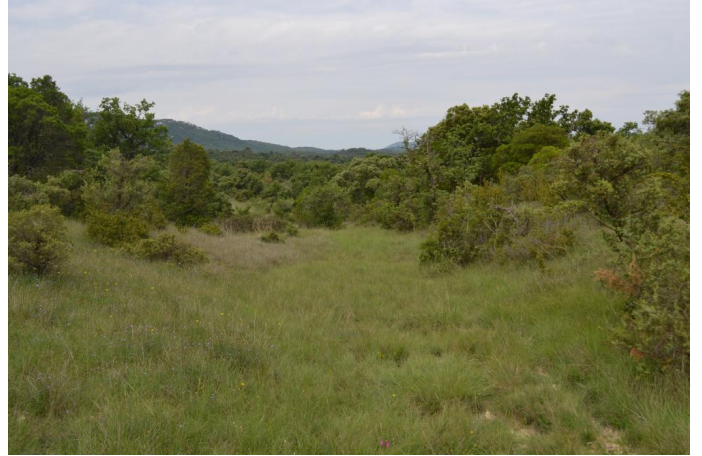
, le 31/05/2017 par Jérémy Cuvelier.