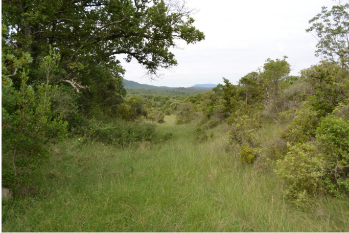
, le 31/05/2017 par Jérémy Cuvelier.