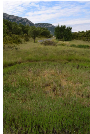
Mare colonisée par la Gratiolle ( Gratiola officinalis ) espèce végétale protégée au niveau national, le 31/05/2017 par Jérémy Cuvelier.