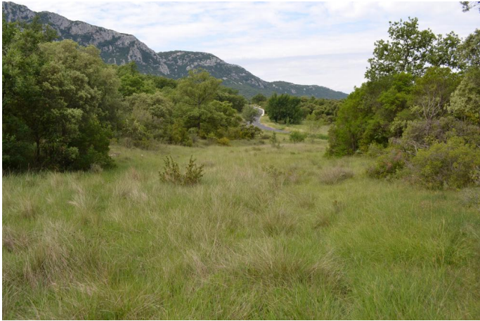
, le 31/05/2017 par Jérémy Cuvelier.