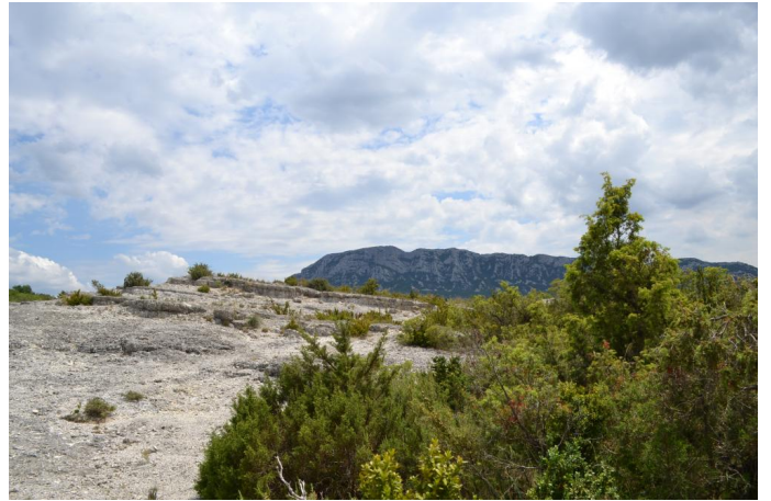
, le 31/05/2017 par Jérémy Cuvelier.