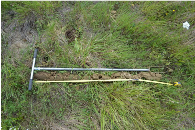
Rédoxisol-rédoxique témoignant d'un engorgement en eau, le 31/05/2017.