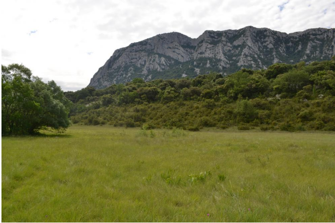
Fasciés de la zone humide de pente, le 31/05/2017 par Jérémy Cuvelier.