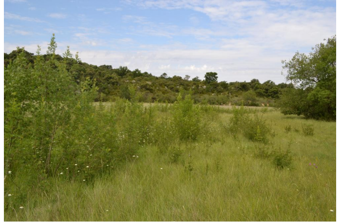
Reconquête par les Frênes, le 31/05/2017 par Jérémy Cuvelier.