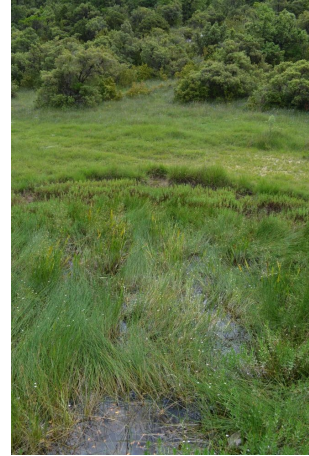
, le 31/05/2017 par Jérémy Cuvelier.