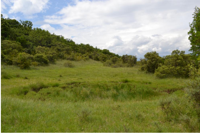
Aperçu de la mare à Eleocharis palustris , le 31/05/2017 par Jérémy Cuvelier.