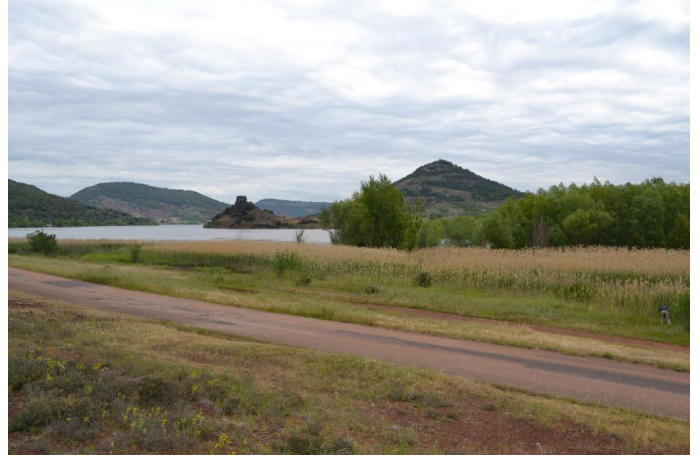
Vers l'ancien aqueduc, le 10/05/2017 par Jérémy Cuvelier.