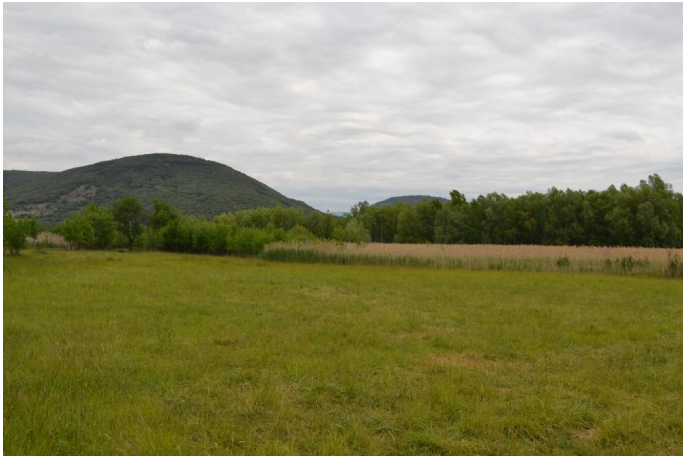
Prairie humide au premier plan puis roselière et ripisylve en second plan, le 10/05/2017.