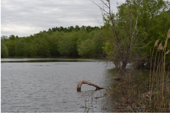
Ripisylve dense rivulaire au lac du Salagou, le 10/05/2017 par Jérémy Cuvelier.