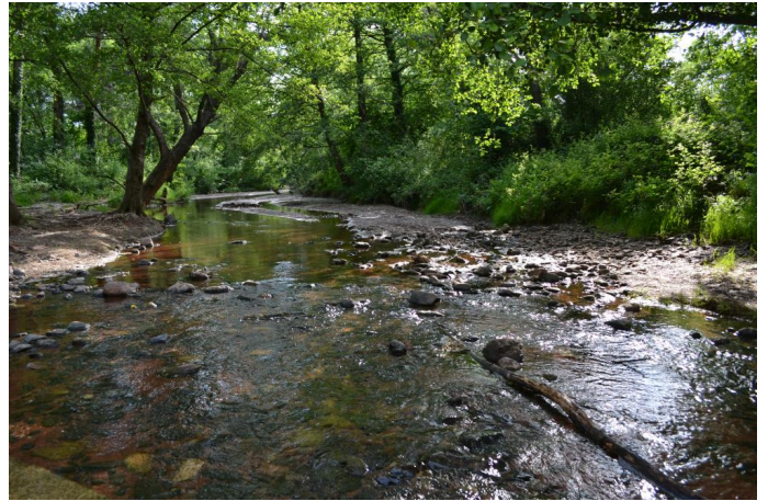
Le Salagou une centaine de mètres en amont de sa confluence, le 10/05/2017.