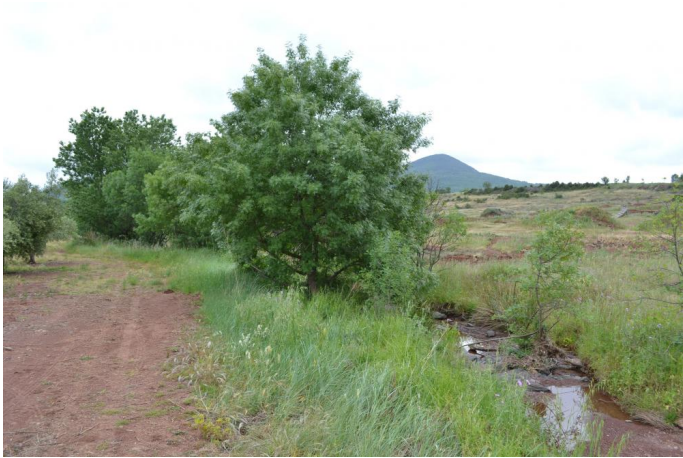
Vers le velocross, le 10/05/2017 par Jérémy Cuvelier.