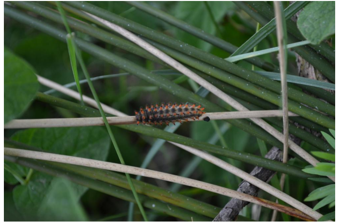
Chenilles de Diane (espèce de papillon protégée au niveau national et européen), le 10/05/2017 par Jérémy Cuvelier.