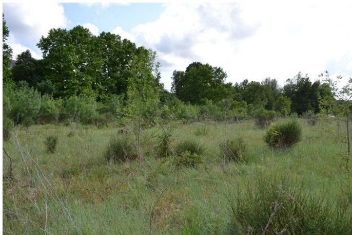
Vers le Capitou, le 10/05/2017 par Jérémy Cuvelier.