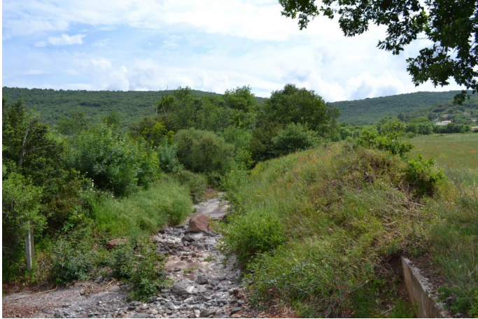
En amont de la RD8, le 10/05/2017.