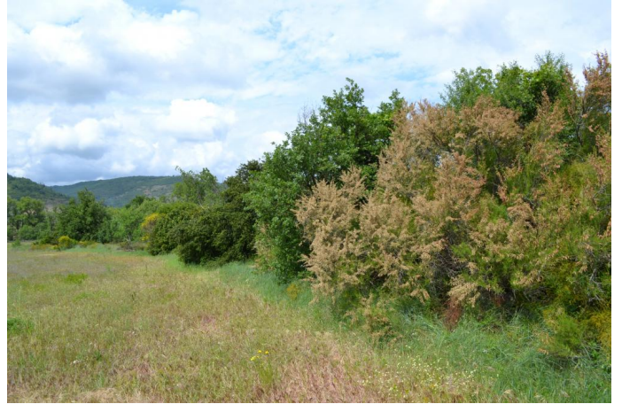
, le 10/05/2017 par Jérémy Cuvelier.