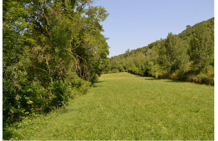
Vers Saint-Charles, le 21/06/2017 par Jérémy Cuvelier.