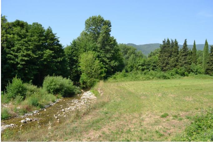
vers St-Martin, en amont de la RD35, le 21/06/2017 par Jérémy Cuvelier.