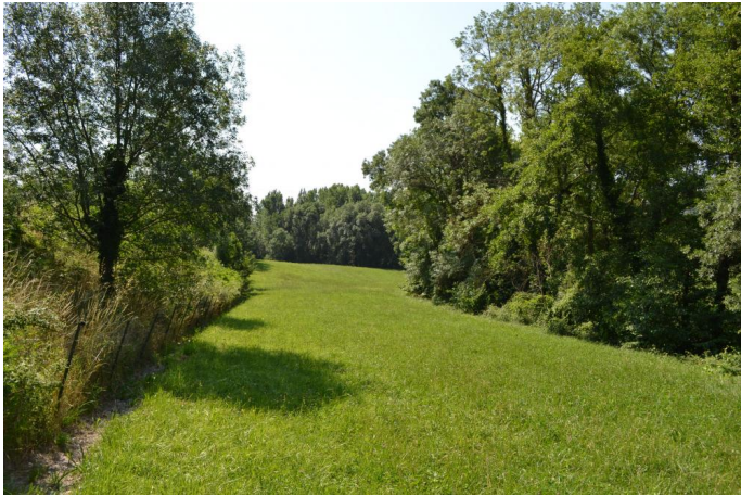
, le 21/06/2017 par Jérémy Cuvelier.