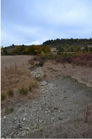
Vers Cabre Motte, le 25/09/2017 par Jérémy Cuvelier.