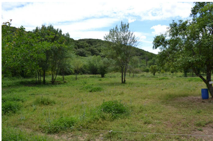
Fasciès des prairies non dominées par des espèces végétales hygrophiles, vers la Tuilerie, le 06/06/2017.