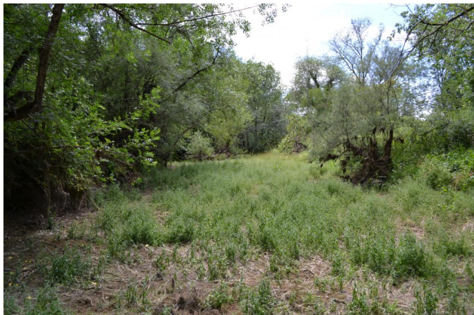
Vers Banal, le 06/07/2017 par Jérémy Cuvelier.