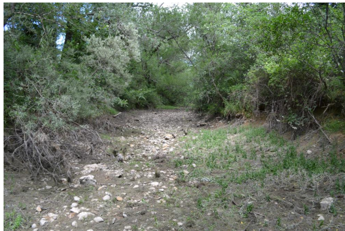
Lit mineur vers Banal, le 06/06/2017 par Jérémy Cuvelier.