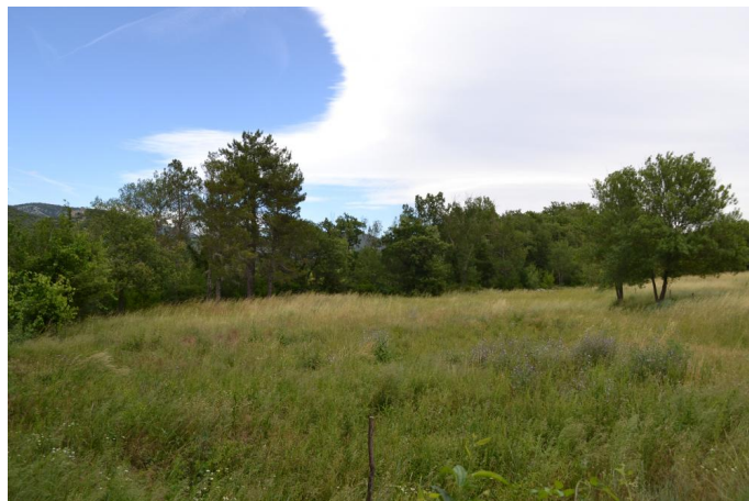
Vers la Maison Neuve, le 06/06/2017 par Jérémy Cuvelier.