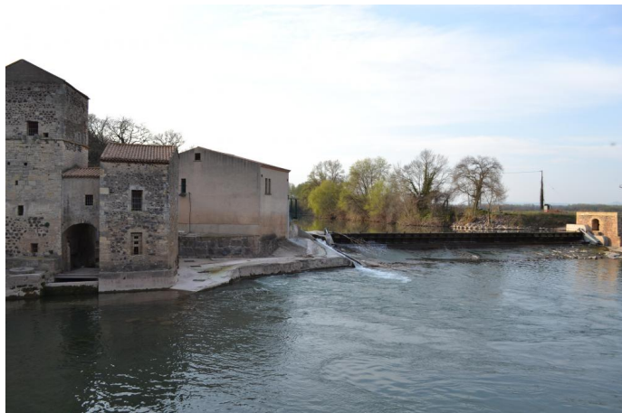
vers Pont romain, le 14/03/2017.