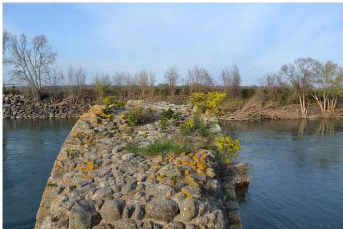
, le 14/03/2017 par Jérémy Cuvelier.