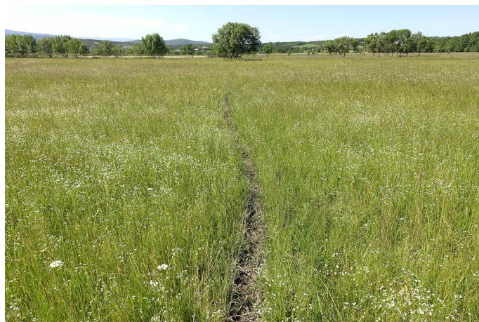
Autre vue de la prairie humide de fauche., le 25/05/2017 par Jean-Laurent Hentz.