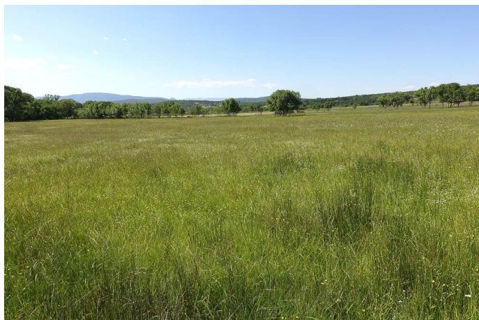
Prairie humide de fauche., le 25/05/2018 par Jean-Laurent Hentz.