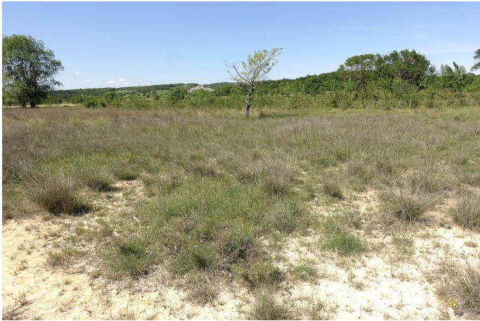
Secteur à CHoin noir sur affleurement marneux., le 25/05/2017 par Jean-Laurent Hentz.