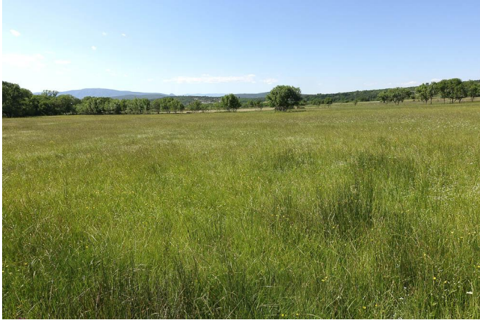
Prairie humide de fauche., le 25/05/2018 par Jean-Laurent Hentz.