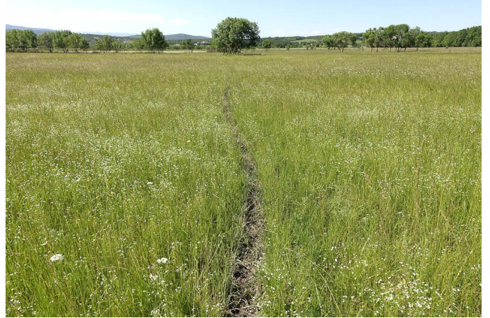
Autre vue de la prairie humide de fauche., le 25/05/2017.