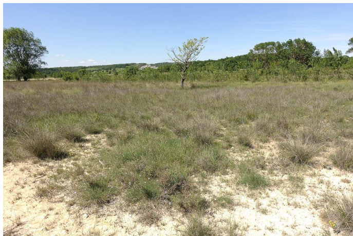
Secteur à CHoin noir sur affleurement marneux., le 25/05/2017 par Jean-Laurent Hentz.