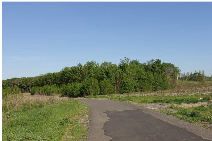
Boisement de Frênes en plaine alluviale., le 30/03/2017.