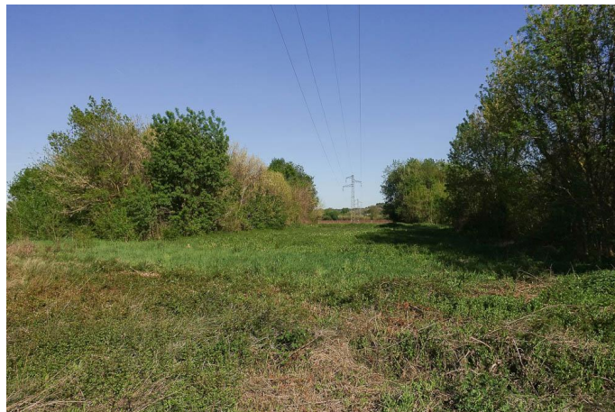
L'entretien sous la ligne HT crée une prairie au potentiel humide., le 30/03/2017 par Jean-Laurent Hentz.